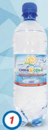
1 Вода минеральная природная питьевая столовая «Синеборье» гидрокарбонатная магниево-кальциевая