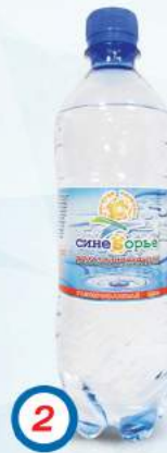
2 Вода питьевая артезианская «Синеборье» 1 категории