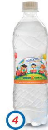
4 Вода питьевая артезианская для детского питания «Синеборье» высшей категории

Качество воды контролируется собственными лабораториями, проводящими ежедневный мониторинг качества выпускаемой продукции, проводится инспекционный контроль всеми санитарными службами Владимирской области, а так же проводится внешний аудит.