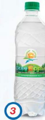
3 Вода питьевая артезианская «Синеборье» высшей категории